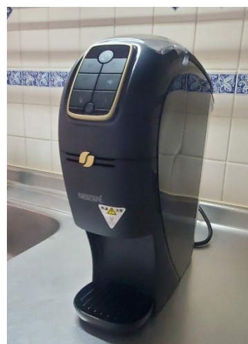
ネスカフェ バリスタ 【(株)太陽様より】